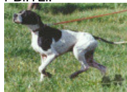
IMAGE DU BOIS DE MOUN 1993-10-23 (F) LOF 71917 - Noi. PBI.Env.

FRAY DU RIOU DE LA CUVE 1990-05-13 (M) LOF 63556/8313 (VCF, CHIT, CH A, CH P, CH T, VOF/FTP) - Noi. PBI.TLi.