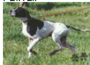
IMAGE DU BOIS DE MOUN 1993-10-23 (F) LOF 71917 - Noï. PBI.Env.

FRAY DU RIOU DE LA CUVE 1990-05-13 (M) LOF 63556/8313 (VCF, CHIT, CH A, CH P, CH T, VOF/FTP) - Noï. PBI.TLi.